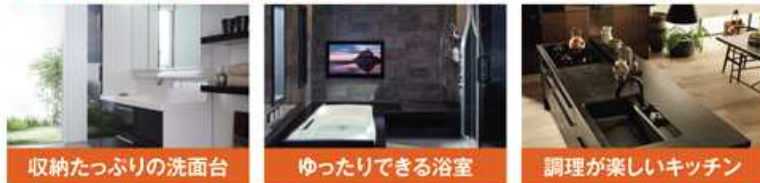
収納たっぷりの洗面台