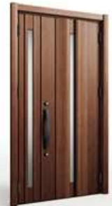
商品画像はイメージです。

工事総額450,000円(玄関ドア本体・取替工事・廃棄費用の目安、消費税込)を想定。オールLIXIL無金利リフォームローンキャンペーン適用、頭金0円、割賦元金450,000円、60回均等払いを想定した試算金額となります。実際の金額とは異なりますので、詳細につきましてはお尋ねください。